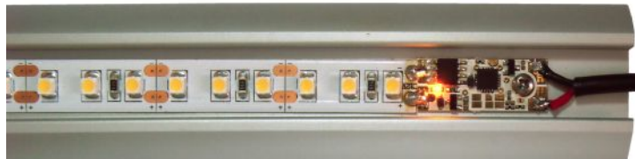
Obr.1 - Ukázka instalace do profilu

*) Napájecí napětí nesmí být vyšší, než maximální napětí použitého LED pásku! **) V režimech 3 a 4 bez stmívání je maximální proud 10A.