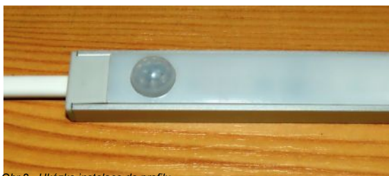
Obr.2 - Ukázka instalace do profilu

Po nastavení požadované hodnoty potvrdíte změnu současným stisknutím obou tlačítek, změna se uloží a LED krátce stroboskopicky zablikají na znamení, že režim nastavení byl ukončen a senzor se přepne zpět do pracovního režimu.